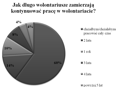
Wykres 2. Deklaracja kontynuowania dotychczasowej działalności w przyszłości