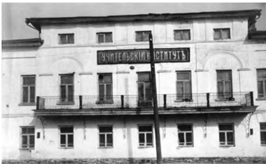
Рис. 8. Учительский институт в Ярославле. Фото начала XX века

Продемонстрировать изменения в педагогическом образовании после революции 1917 года целесообразно на примере работы конкретного образовательного учреждения. Учительский институт в Ярославле (см. рис. 8) в первые годы после революции был существенно реформирован.