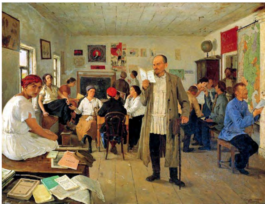
Рис. 7. «Школьные работники. Переподготовка учителей». Художник – Е.М. Чепцов, 1925 г.

Готовившие до революции педагогов женские гимназии были ликвидированы вследствие введения совместного обучения мальчиков и девочек. Разделенных по гендерному принципу образовательных учреждений в России не стало.