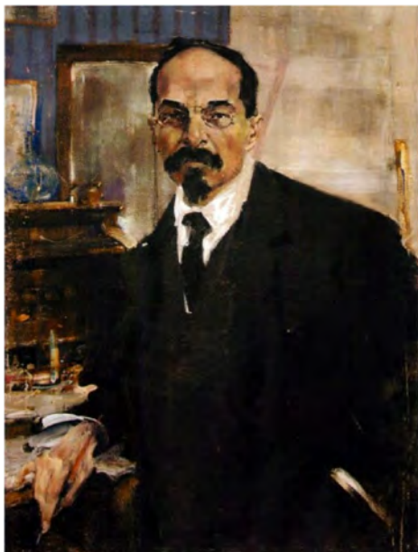
Рис. 3. Портрет А.В. Луначарского. Художник – Н.И. Фешин, 1920 г.

На деятельность Наркомата просвещения значительное влияние оказывала жена В.И. Ленина Надежда Константиновна Крупская . Теоретик образования, историк педагогики, она выступила организатором и идеологом советского образования. Более того, своим примером и отношением к труду Крупская способствовала переоценке роли женщины в советском обществе.