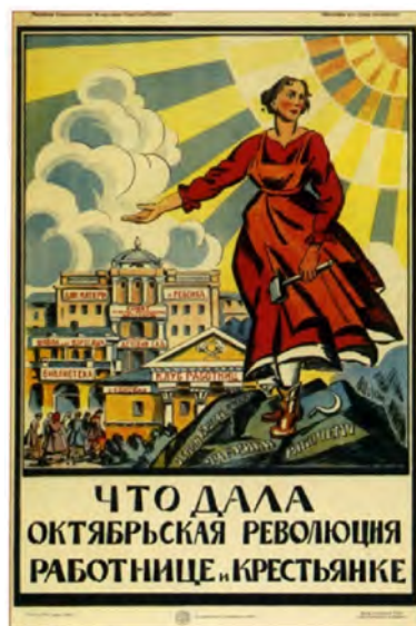
Рис. 4. Советские плакаты – об изменении роли женщины в обществе