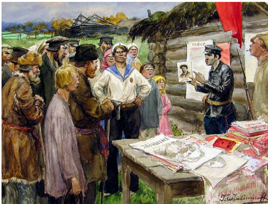
Рис. 2. «Агитатор». Художник – И.А. Владимиров, 1917-18 гг.

Нарком требовал «обеспечения всеобщей грамотности и создания сети школ, отвечающих требованиям современной педагогики», для чего нужно мобилизовать «армию народных педагогов» 16 . Будучи в Ярославле в 1924 году, А.В. Луначарский ознакомился с постановкой учебного процесса в педагогическом институте. Обращаясь к студентам, он напутствовал: «Наша эпоха – сверхчеловеческая. Она требует мобилизации сил и способностей всего нашего народа. И если у вас будут трещать кости и рваться мускулы, но всё же вы будете работать – только тогда вы сможете считать себя современником нашей эпохи» 17 .