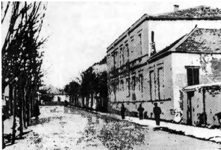
Рис. 6. Учительская семинария в г. Гори (Грузия), работавшая по проекту К.Д. Ушинского в 70-80-е годы XIX века.

Семинария поддерживала связь с учителями – бывшими ее воспитанниками. Она являлась своего рода педагогическим центром, при котором организовались высшие педагогические курсы для лиц, получивших университетское образование, руководители и учителя семинарии организовывали лекции на педагогические темы 24 . Автор проекта высказал мысль и о педагогических факультетах университетов, где бы готовились преподаватели педагогики и учителя средней школы. Благодаря Ушинскому в педагогическом образовании утверждаются новые формы, а подготовка педагогов становится одной из первоочередных задач Министерства народного просвещения. Однако многие из идей Ушинского были реализованы лишь после Октябрьской революции.