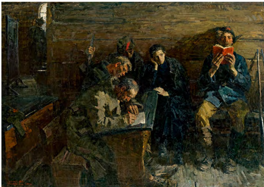
Рис. 5. «Между боями». Художники – А.П. и С.П. Ткачевы, 1958-60

На рис. 5 представлена репродукция картины А.П. и С.П. Ткачевых, изображающая солдат-революционеров, которые изучают грамоту в сельской школе. Художники подчеркивают трудности учебы: взрослые мужчины неловко водят карандашом по бумаге, а молодой парень складывает буквы в слога, читая книгу. Глаза его не поднимаются от страниц, беззвучно шевелятся губы. Худенькая учительница сидит рядом тихо, чтобы дать красноармейцам время справиться с заданным уроком. Художники показывают внутреннее обновление обездоленного прежде человека, его стремление вырваться из тьмы невежества.