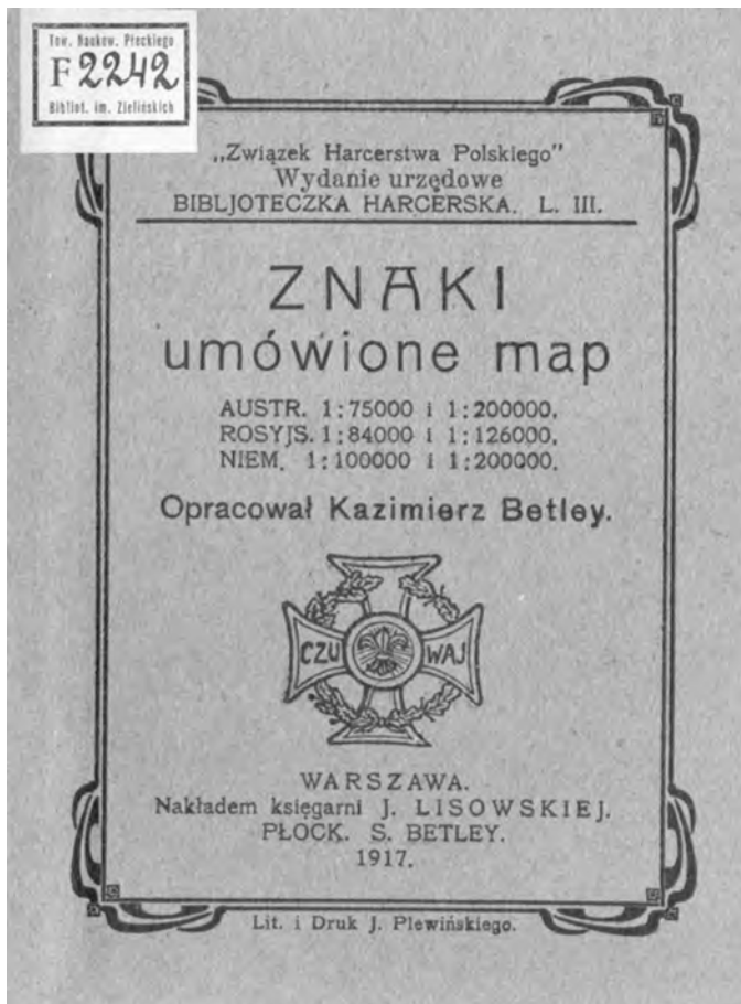
Fot. 2. Broszura K. Betleya „Znaki umówione map” (ze zbiorów Biblioteki im. Zielińskich TNP)

Obie broszurki zostały wydane nakładem księgarni J. Lisowskiej w Warszawie, jednak niżej znajdujemy także „PŁOCK, S. BETLEY”, co chyba oznaczało współfinansowanie wydania przez ojca Stanisława Betleya.