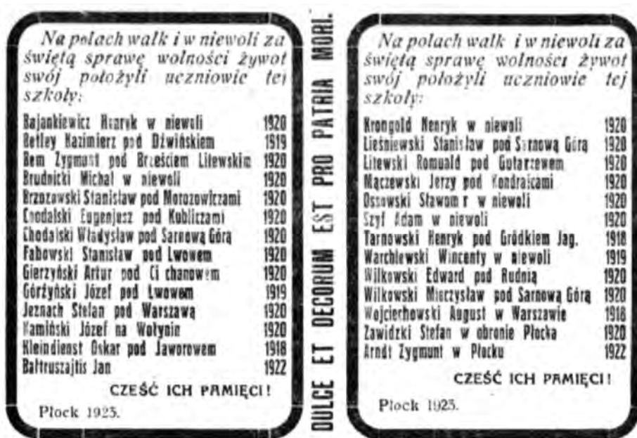
Fot. 6. Wygląd tablic upamiętniających uczniów Gimnazjum im. Władysława Jagiełły, poległych i zmarłych w latach 1918-1922 („Dziennik Płocki” 1923, nr 223 z 2.10., s. 3)

Dalekie pokolenia, widząc wyryte w tym marmurze, pamięcią i czcią otoczone imiona uczniów – bohaterów, czerpać stąd będą otuchę i wytrwałość w pracy, brać będą przykłady i naukę jak kochać trzeba Ojczyznę, jak pojmować obowiązki dobrego jej syna, jak oddawać jej wszystko aż do krwi i życia, gdy tego zażąda. A dopóki takich synów mieć będzie, nie zginie Polska, ale żyć będzie, rosnąć w potęgę i chwałę” 101 .