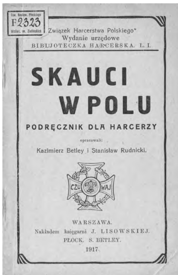
Fot.1. Strona tytułowa podręcznika dla harcerzy „Skauci w polu”.

W zachowanych w Bibliotece Narodowej numerach „Harcerza” jest to jedyny artykuł podpisany przez K. Betleya, ale ponieważ tylko niektóre artykuły były sygnowane imieniem i nazwiskiem autora, nie można wykluczyć, że było ich więcej 33 .