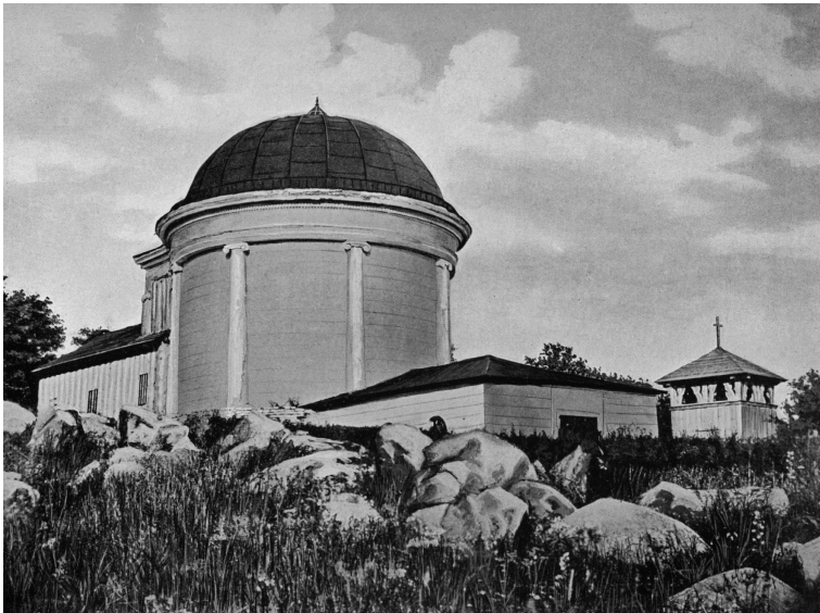
Fot.4. Kościół i kaplica grobowa Krasieńskich ufundowana przez Wincentego Krasieńskiego. Widoczna drewniana dobudówka (nawa) od strony wejścia głównego. Stan przed r. 1874 – Fot. Antoni Woźniak. Kraj w obrazach. Zbiór fotografii najbardziej uwagi godnych miast, okolic, zabytków starożytności i dzieł sztuki. Seria I: Królestwo Polskie. Kraków 1899.