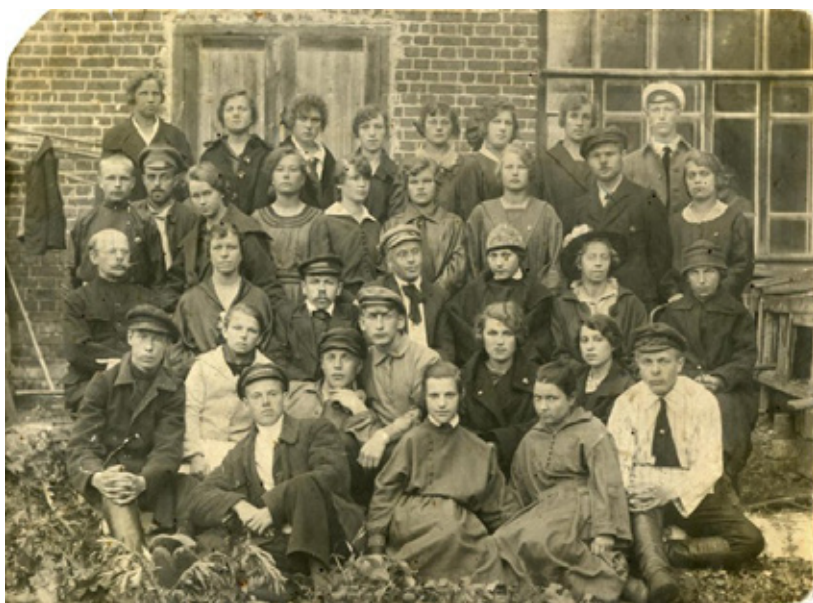
Рис. 4. Ученики советской школы II-й ступени г. Мологи, 1924 г. 2

Таким образом, собственных помещений у семинарии не было. Мужская гимназия была преобразована в 1-ю советскую школу II-й ступени (на Рис. 4 представлено фото 1924 г. с учениками этой школы, как полагается, перед её стенами). Здесь-то и проходили занятия с семинаристами во второй половине дня, - после завершения уроков в школе.