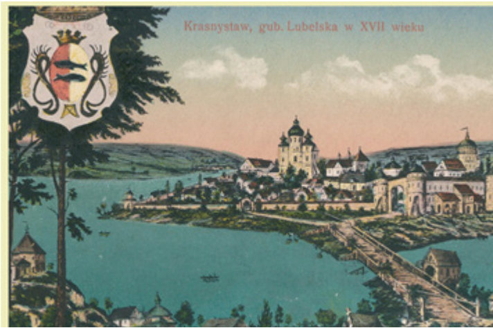
Рис. 1. Открытка XVII в. «Красностав Люблинской губернии».