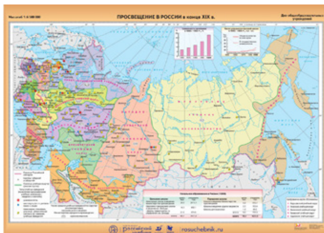
Рис. 3. Учебные округа России в конце XIX в.

В 1890-х гг. на территории России действовало свыше 60 как земских, так и правительственных учительских семинарий, а к 1917 г. их число составило уже 174 [6]. Из всех учебных округов страны наибольшее количество учительских семинарий приходилось на Варшавский учебный округ. Исследователи объясняют данный факт тем, что восемь из девяти семинарий были преобразованы из ранее открытых здесь педагогических курсов [7, с. 6]. Всего же педагогических учебных заведений в округе было 10 [8] (для сравнения: в некоторых учебных округах, например, в Туркестане, в конце XIX в. не было ни одного подобного учебного заведения).