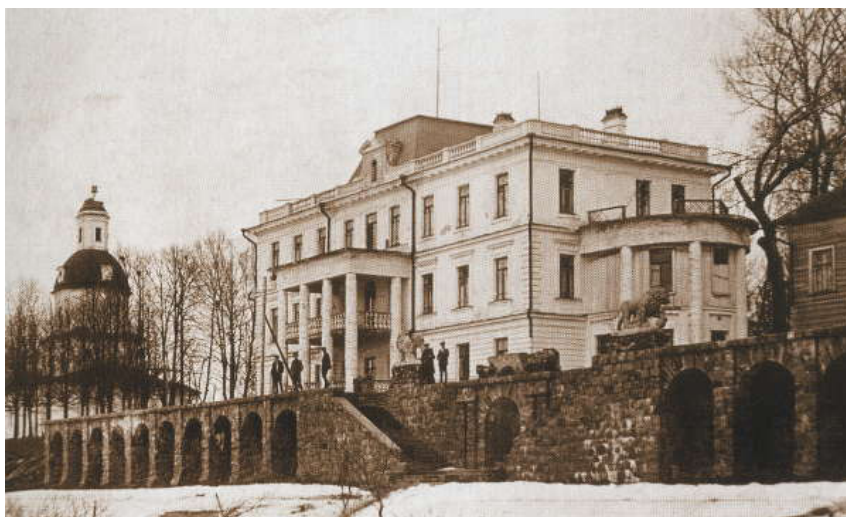
Рис. 5. Имение Мусиных-Пушкиных Иловна Мологского уезда, куда, судя по протоколу педагогического совета, уездная коллегия по народному образованию планировала перевести Мологскую учительскую семинарию 3 .

9 июля 1919 г. Народным комиссариатом просвещения было принято Постановление о преобразовании на территории России учительских семинарий в педагогические курсы или в Институты народного образования. Целью такого решения указывалось «поднятие качественной и количественной сторон подготовки школьных работников 1-й ступени Единой трудовой школы» [12, л. 58]. Всё имущество преобразуемых учительских семинарий (земля, здания, учебно-вспомогательные учреждения), а также и кредиты, переходили новым педагогическим учреждениям. [Там же, л. 59].