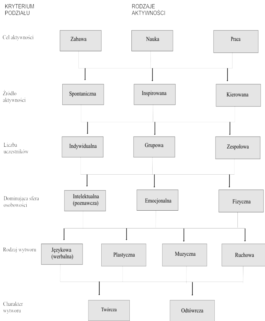
Rysunek 2. Rodzaje aktywności dzieci wyodrębnione ze względu na różne kryteria (Uszyńska-Jarmoc, 2003, s.30)